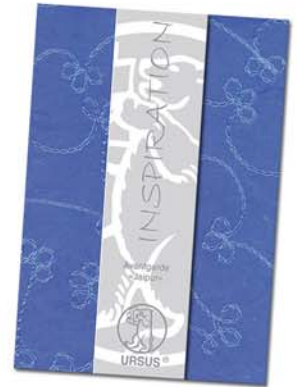
Avantgarde »Jaipur«: handgeschöpftes Naturpapier mit Seidenfasern, bestickt mit Seidengarn